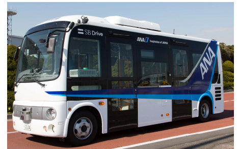
実証実験で使用する自動運転バス

なお、この実証実験は、「航空イノベーションの推進」と「地上支援業務の省力化・自動化」に向けて、国土交通省が全国4つの空港で実施する、空港制限区域内における乗客・乗員などの輸送を想定した国内初の自動走行実証実験の一環として実施するものです。